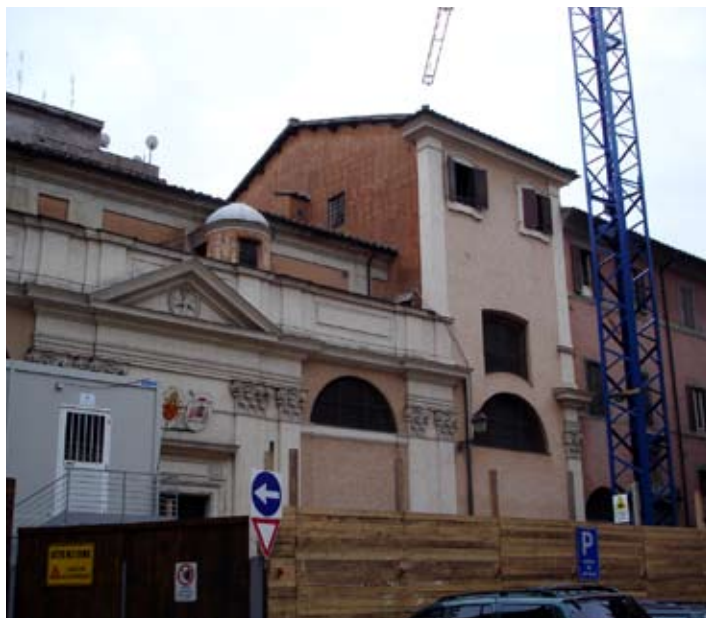
il cantiere della biblioteca

2007 Data di ultimazione dei lavori dell'Apollinare.