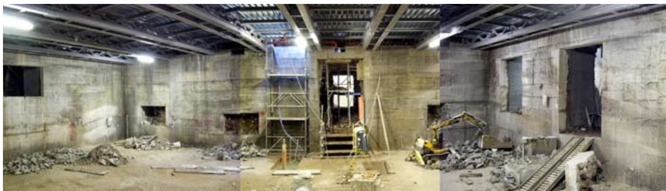
l'Aula Magna dell'Apollinare